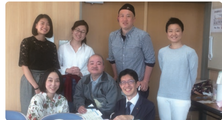
子どものいるLGBT家庭について]の勉強会