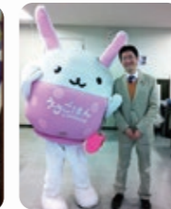
中野区食育キャラクター「うさごはん」と