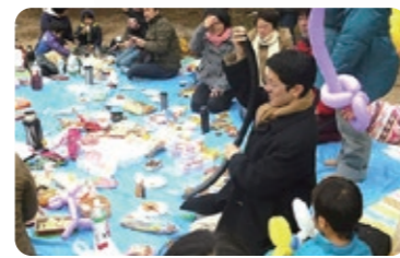
ひとり親家庭のピクニックに参加