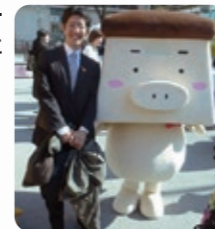
中野区観光キャラクター「クルトン中野」と

同性パートナーシップ制度が実現しましたが、制度の改善を進めます。LGBTが陥りやすい精神的、社会的なつまずきや孤立を防ぎ、相談がしやすく、支援を得やすい中野にします。